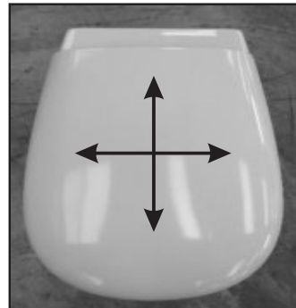
07 Verificare il corretto posizionamento del copriwater prima di serrare definitivamente il fissaggio. Before tightening the fixing screw check the correct position of the seat cover.