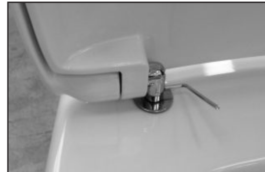
09 Stringere con la chiave in dotazione (brucola) la cerniera sul pin di fissaggio. Tighten the hinge on the screw's pin by using the provided key.