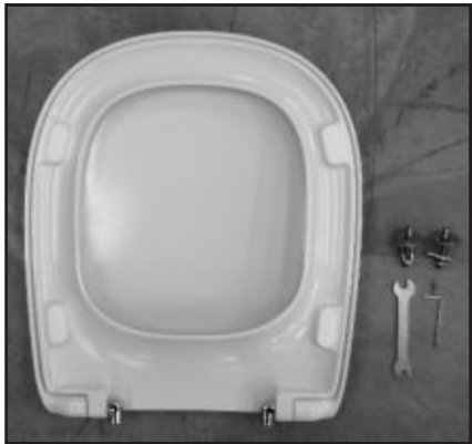
01 Composizione. Composition.