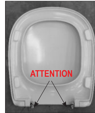
L Sinistra R Destra 05 Inserire le cerniere negli appositi fori. Insert the hinges in the appropriate openings.