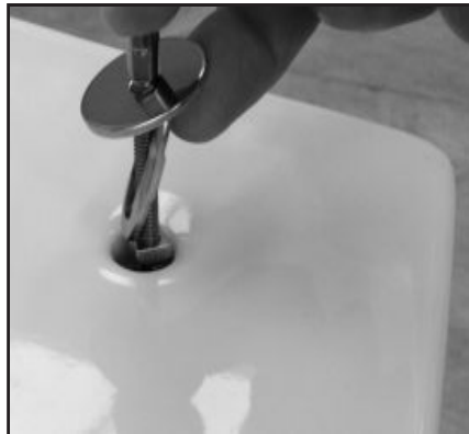
02 Inserire fissaggio nel foro del WC. Fixing screw insertion in the wc's opening.