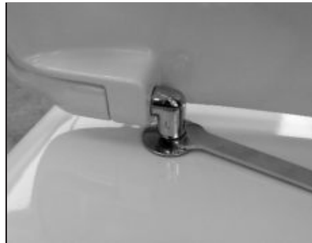
08 Stringere con la chiave in dotazione il fissaggio. Tighten the fixing screw by using the provided key.