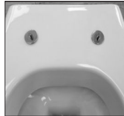
04 Fissaggi inseriti. Inserted fixing screws.