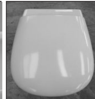
10 Copriwater installato. Installed seat cover.