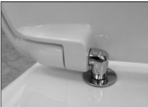
06 Alloggiare il Cw negli appositi fissaggi senza bloccare. Insert the seat cover in the appropriate fixings do not block.